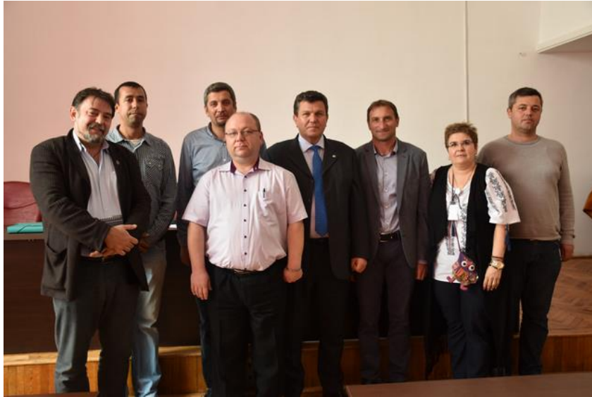
BIROUL EXECUTIV CENTRAL

Mulțumim tuturor participanților la Adunarea generală , dovedind dorință de implicare în activitatea organizației profesionale Corpul Național al Polițiștilor .